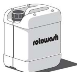
Моющее средство «Rotowash Эскалатор» Концентрат 10 кг Уменьшает износ щёток